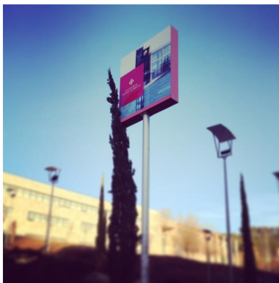
Fig. 1. Campus de Cuenca . José A. Perona. 2015

Todas las figuras y tablas se colocarán en un lugar próximo al que se citen por primera vez (es necesario referenciarlas). Se colocará un pie Fig. seguido del número debajo de cada imagen o fotografía y un pie. Todas las fotografías deben tener una resolución de 300 puntos por pulgada.